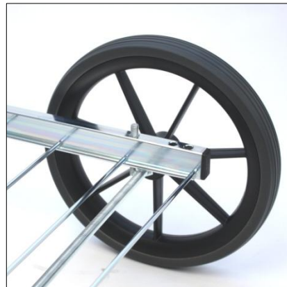
Börja med att montera hjulaxeln i det tredje hålet bakifrån.