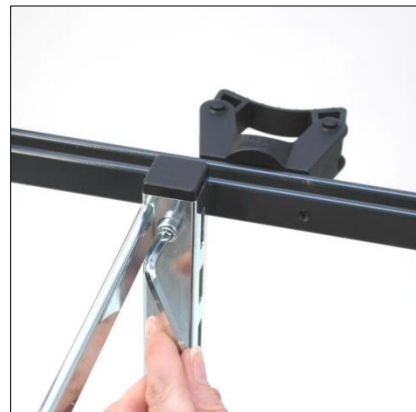
Sedan monterar du modulramen mot styret i det gängade hålen enligt bilden.