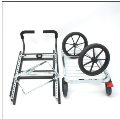
Basdelar till Activa Synergy Trapp