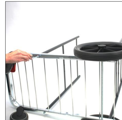
På samma sätt monterar du dit säckbågen på underredet