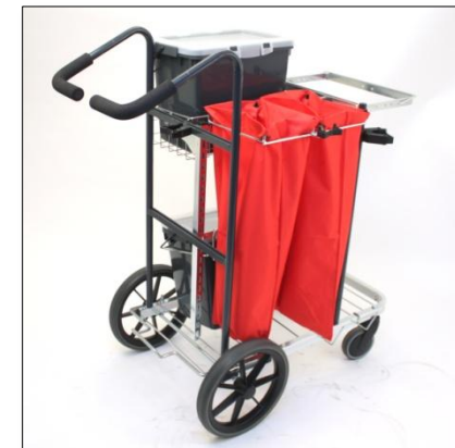
Komplett Activa Synergy Trapp 29176.