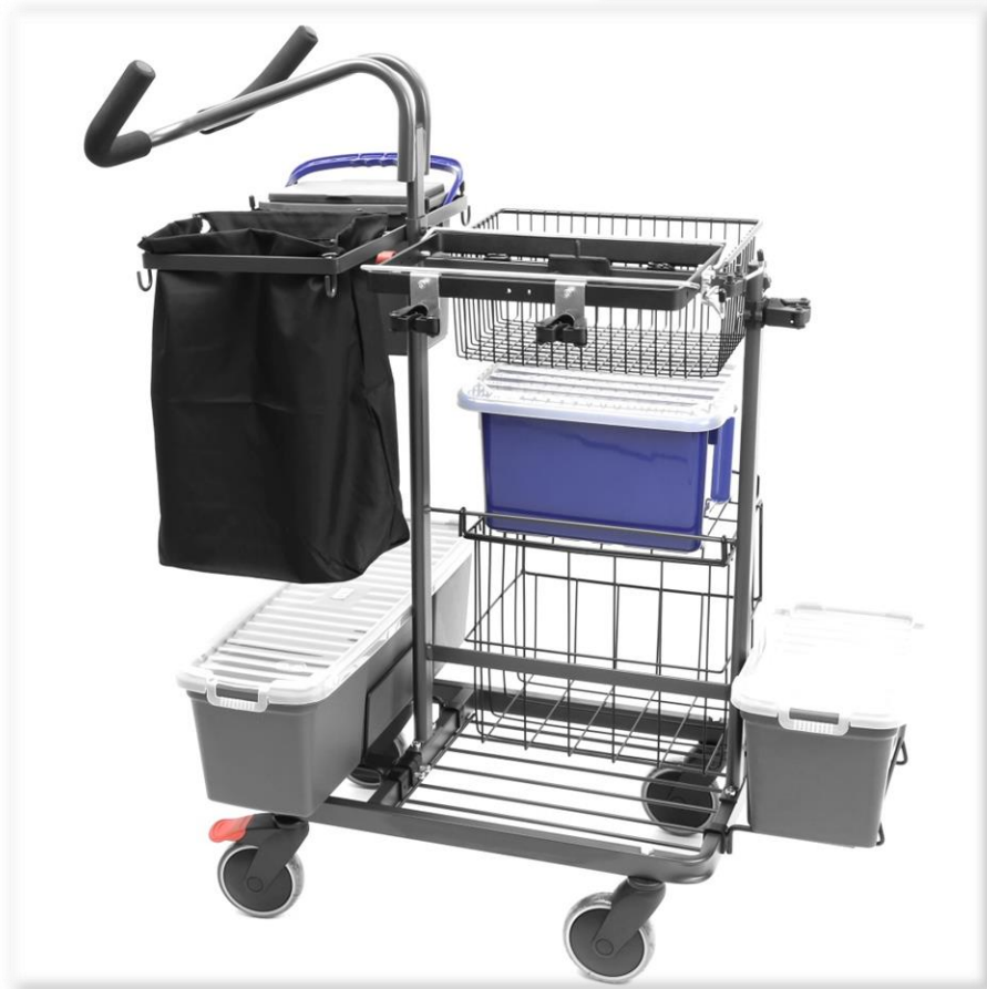
Placera övriga detaljer enligt bilderna.