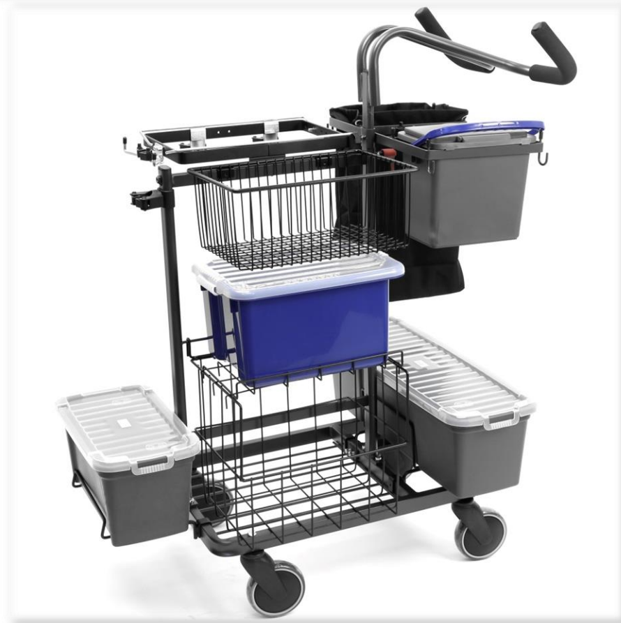
Komplett 29375 NK Städvagn Mellan