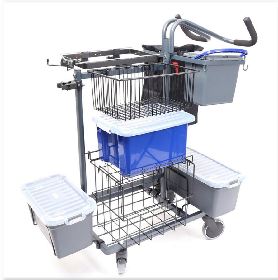
Färdig 29375 NK Städvagn Melan.