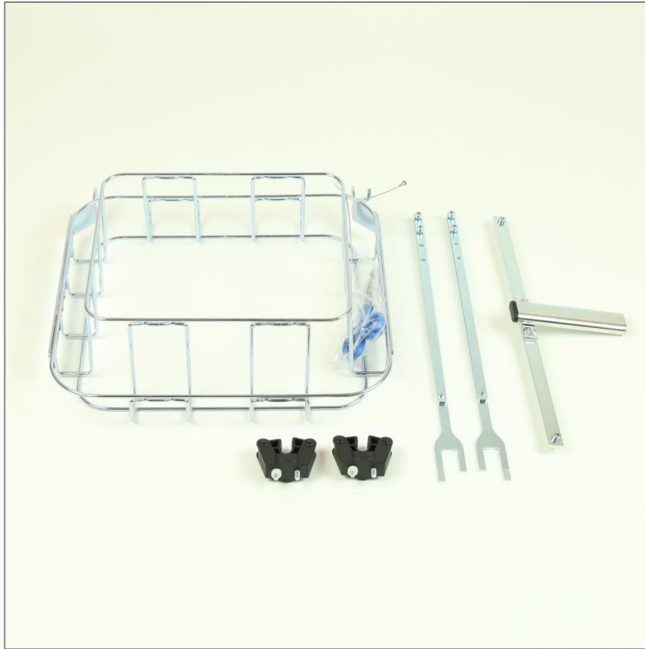
Delarna till Säckhållare Longopack