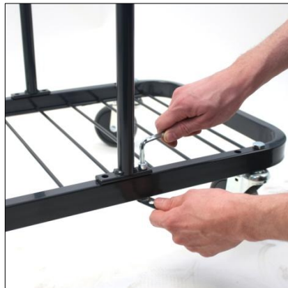
Börja med att montera styret på underredet enligt bilden.