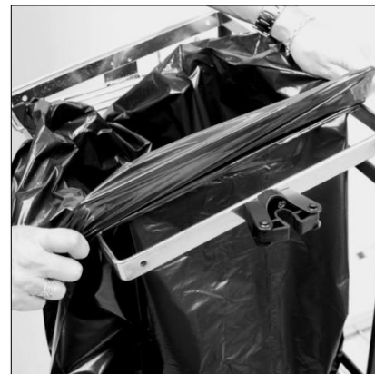
Vik säcken över den ena trådbygeln.