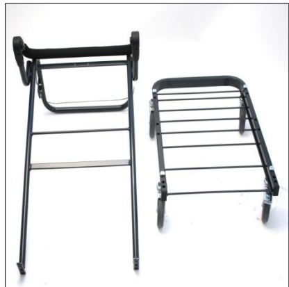
Basdelar till Tripp 29461