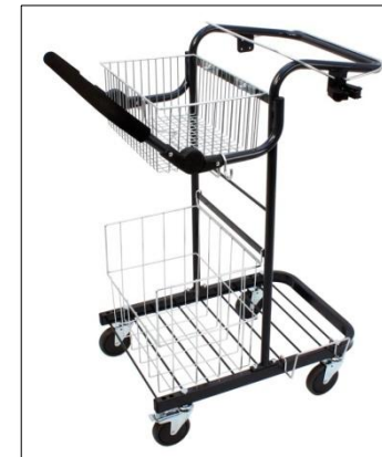
Komplett Tripp 29461.