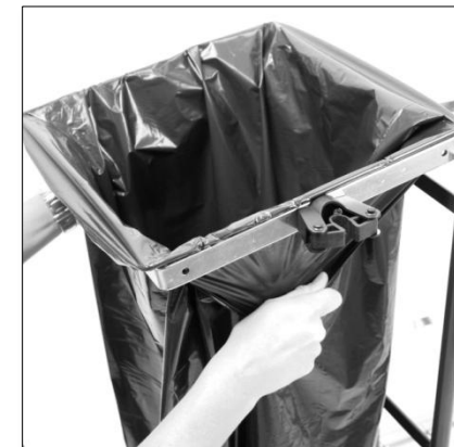
Fixera säcken genom att dra den neråt enligt bilden.