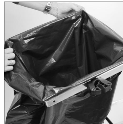
Gör sedan likadant på motsvarande sida och fäll ner trådbyglarna.