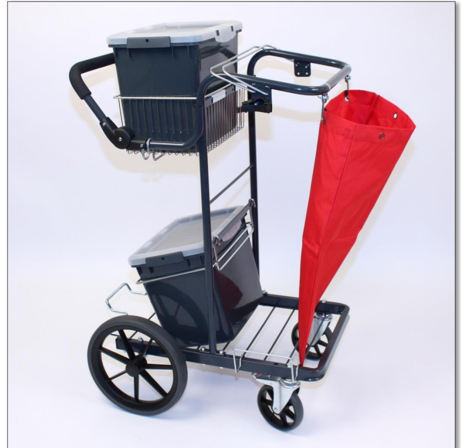
Komplett 29464 Trapp Fastighet Städvagn

Tryck dit stativhållaren framtill på höger sida av underredet. (1) Tryckfast fot och moppstödet ordentligt i hålet längst bak. (2) Haka på hinkbygeln enligt bilden. (3) Skruva fast toolflex 20-30 på säckhållaren. (4)