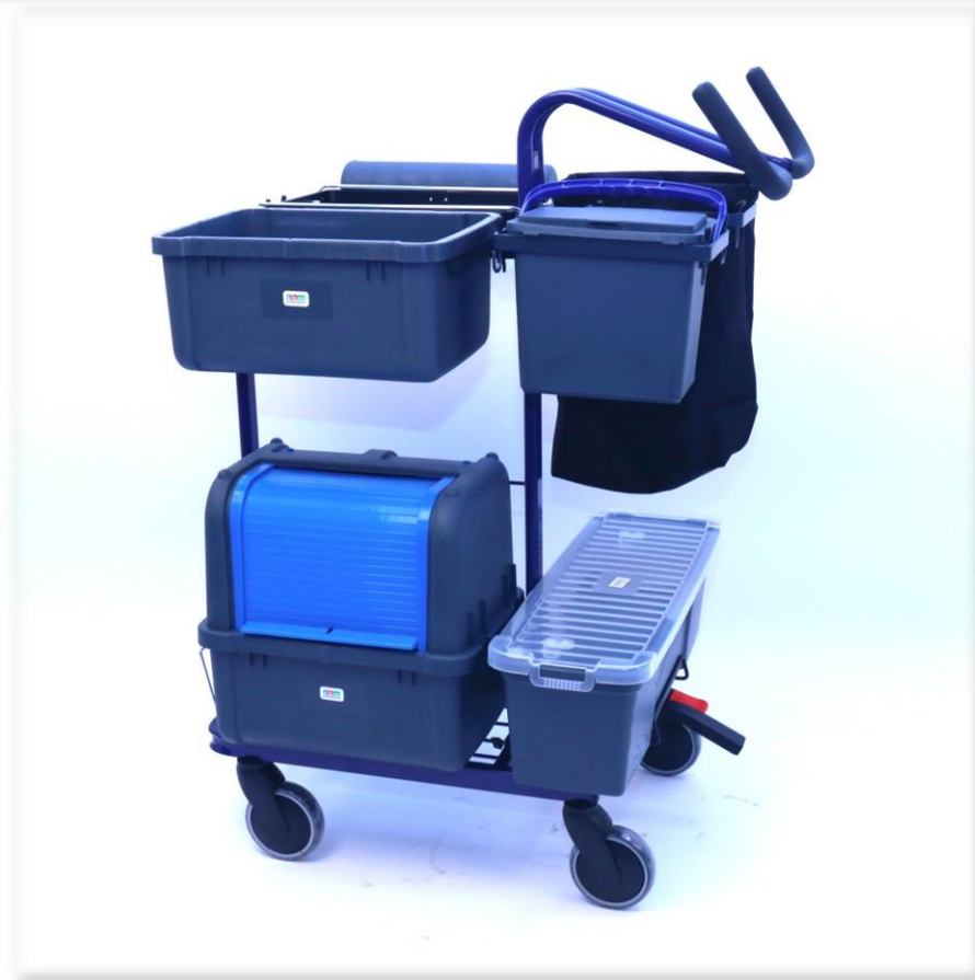
Placera övriga detaljer enligt bilden.