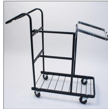
Bild på basvagn

Det undre d-kommandot ska skruvas med insexskruv M6x20mm och låsmutter M6 i säckbågen. Det övre d-kommandot och säckhållaren skruvas med insexskruv M6x25mm och låsmutter M6 i säckbågen. Som bilden ovan visar.