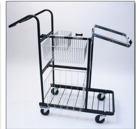
Bild på den kompletta vagnen