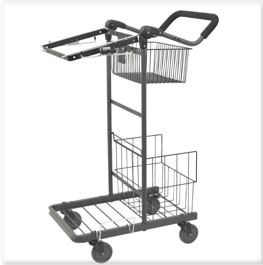
Komplett Tripp3 vagn