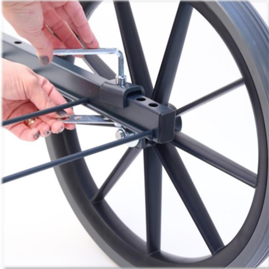
Häng hjulet med hjulfästet på underredet och skruva fast med insexskruv M8x45 och låsmutter M8.