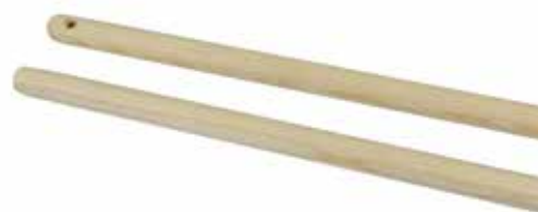
Träskaft 24001, olackerat, 150 cm.