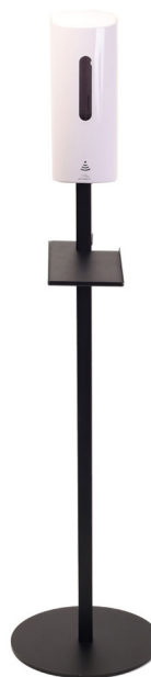
DAX Automatisk Dispenser 700 ml Art.nr. 30056