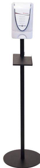
Dispenser Deb Touch Free TF2 Art.nr. 52304