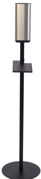
Tork Dispenser Sensor S4 Art.nr. 50245