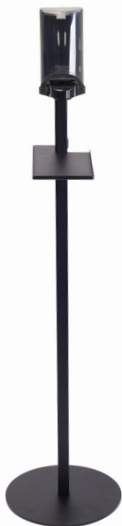
Dispenser Sterisol Art.nr. 51042