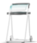
652000 Tork Golvställ