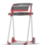
652008 Tork Golvställ