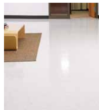
Efter upprepad användning